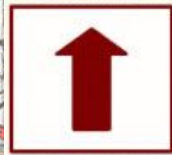
Go straight ahead 直走