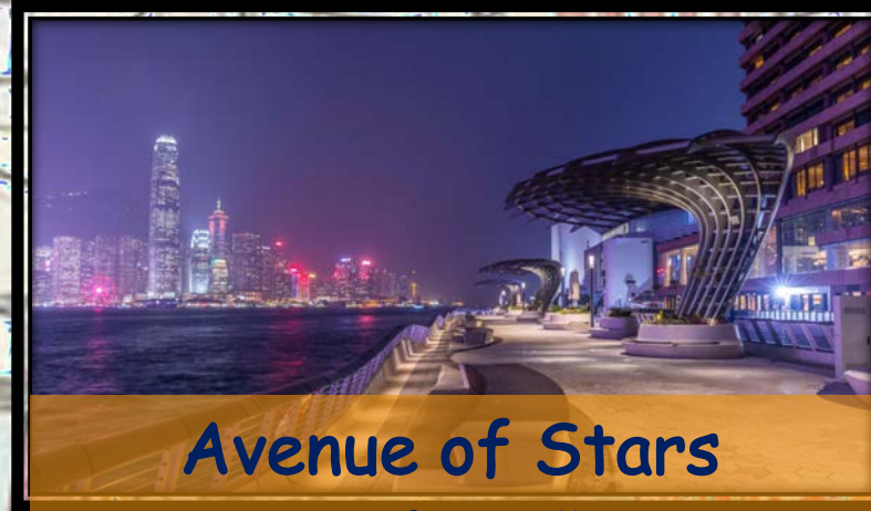
Avenue of Stars 星光大道