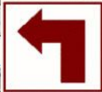
Turn left 左轉