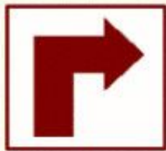
Turn right 右轉