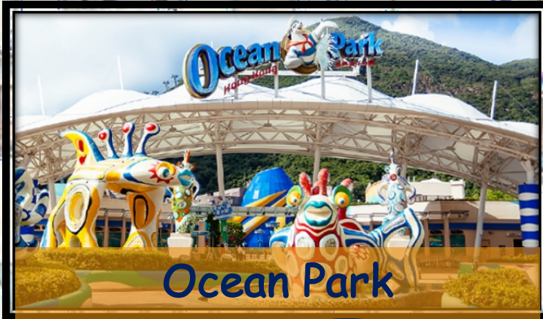
Ocean Park 海洋公園