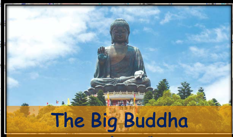
The Big Buddha 天壇大佛