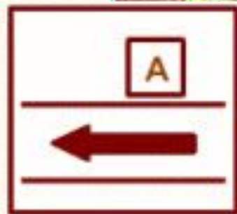
Go pass 經過