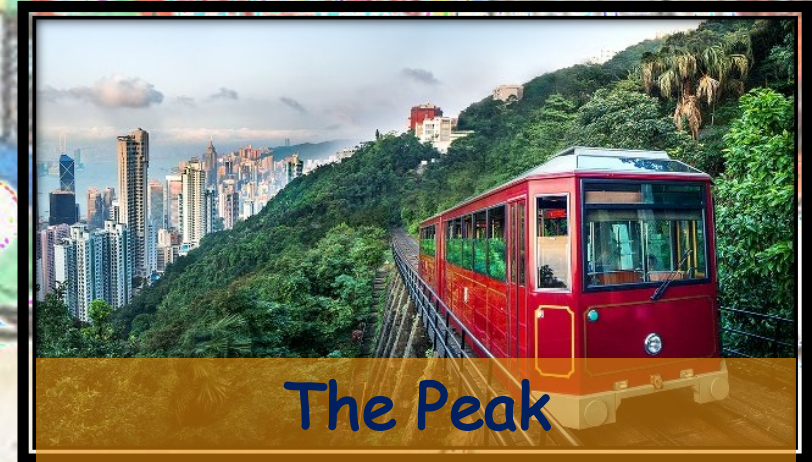
The Peak 太平山頂