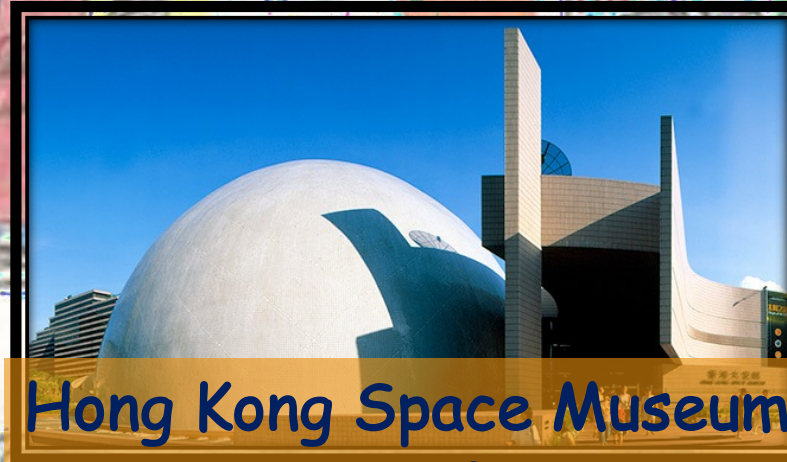
Hong Kong Space Museum 香港太空館