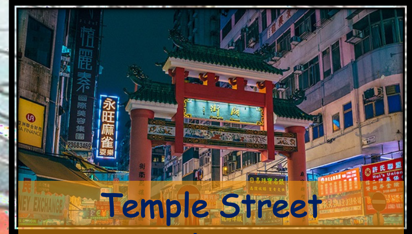
Temple Street 廟街