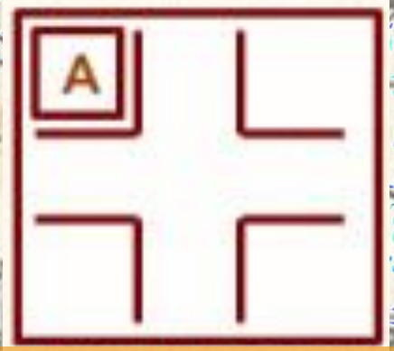
At the corner of... 在...的角落